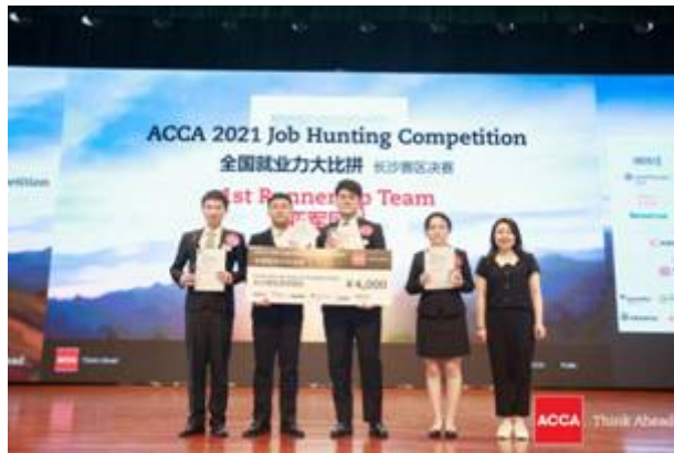
2021 年 ACCA JHC 全国就业力大比拼长沙赛区亚军