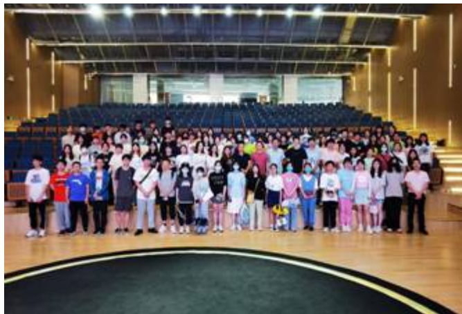
2020 级 ACCA 学生参加企业见习