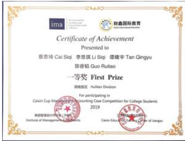
2016 级 ACCA 班学生获 2019 届管理会计案例大赛湖南省一等奖