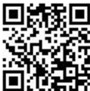
2022 级会计学专业 ACCA 方向班报名意向表二维码