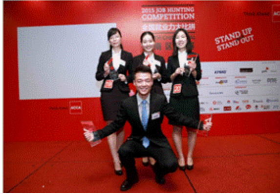
2015 年 ACCA JHC 全国就业大比拼华南区决赛季军

会计学 ACCA 方向班学生体现出良好的综合素质能力，班级氛围活跃，教师学生获得各项奖励达 600 多项，ACCA 班的学生在国内高端竞赛上，名列前茅。